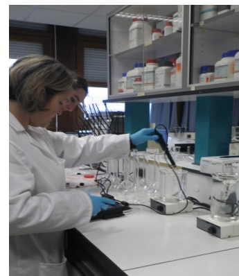
Laboratoire des Eaux PFT GH 2 O

Agents d'exploitation, référents administratifs assainissement, acteurs de la Police de l'Eau, Agence de l'Eau, collectivités, Techniciens et Ingénieurs non spécialistes.