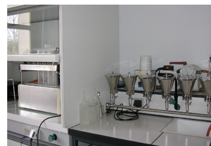
Minéralisateur et rampe de filtration (Laboratoire des Eaux – PFT GH 2 O)