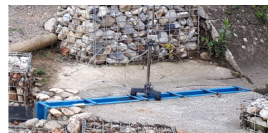
Matériels de prélèvement et de métrologie (PFT GH 2 O)